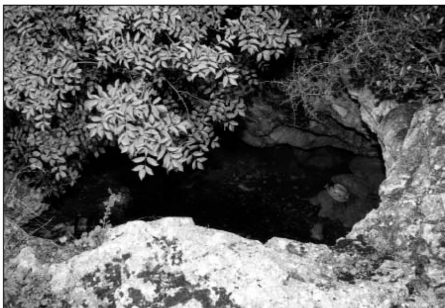
Ingresso della Buca dei Pipistrelli.